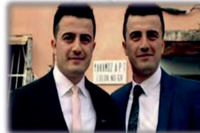
15 Temmuz'da Şehit Edilen Polisler